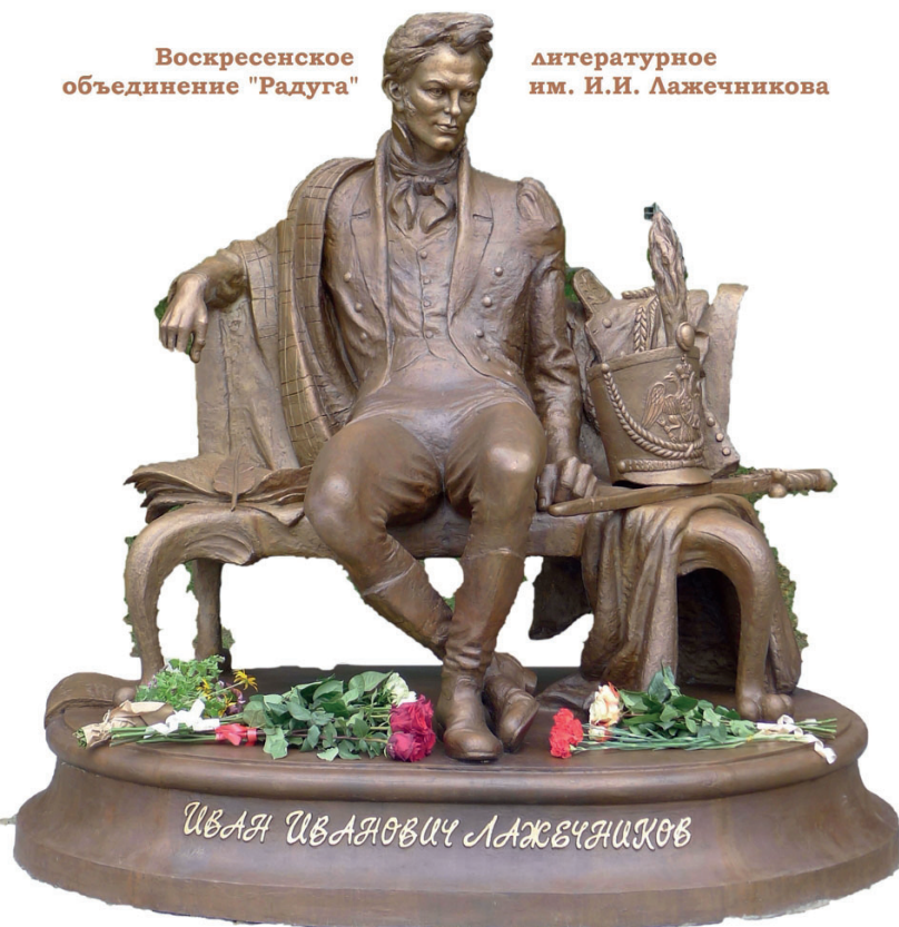
Воскресенское литературное объединение «Радуга» им. И.И. Лажечникова