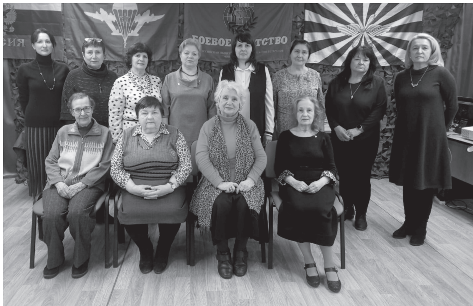
На встрече Бронницкого городского отделения МОО ВООБ «БОЕВОЕ БРАТСТВО»