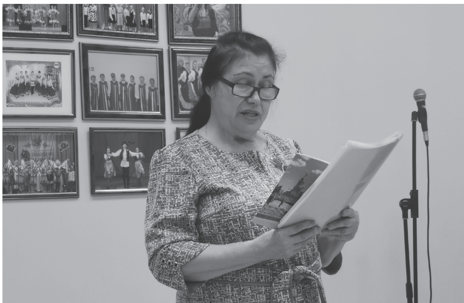
Выступление в ДК «Вохринка» Раменского района