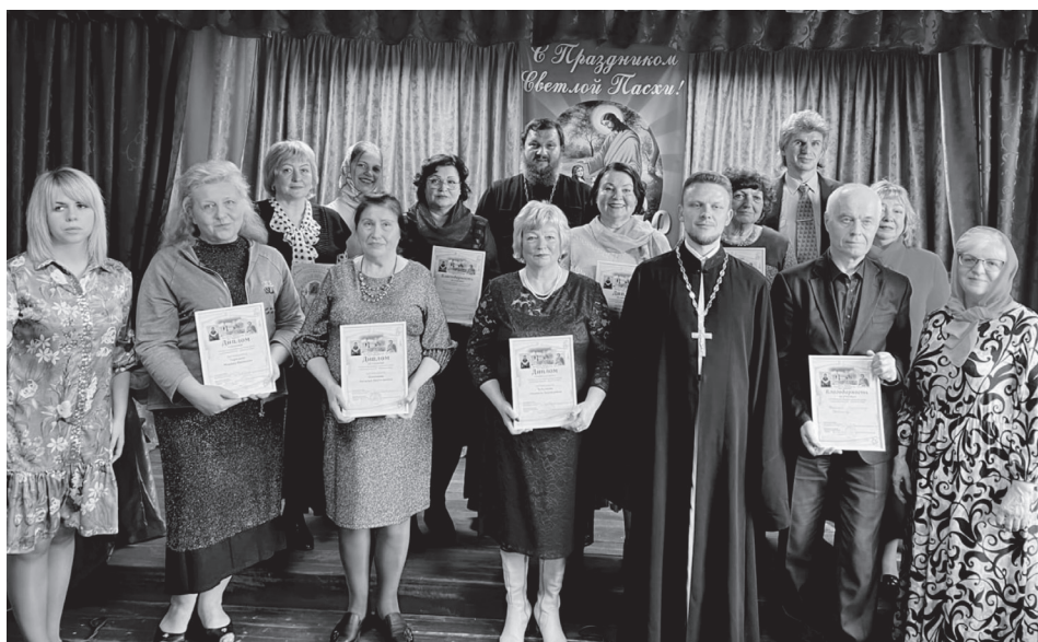
На конкурсе духовной поэзии в храме Покрова Пресвятой Богородицы с. Боршева