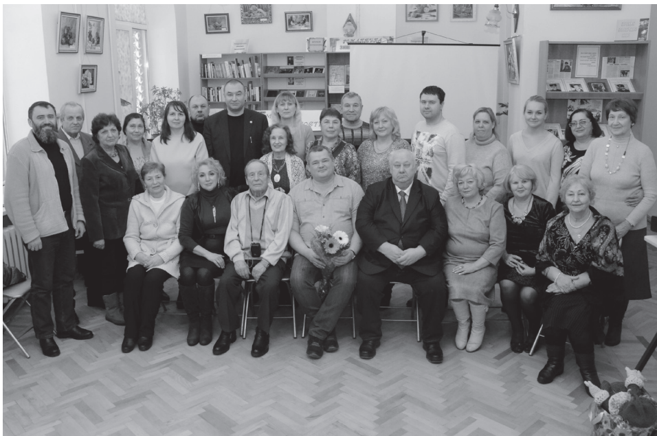
В воскресенском ЛИТО «Радуга» им. И. И. Лажечникова